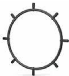
Aro con proyecciones