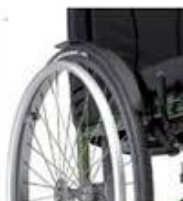
Protector de ropa

- Accessoris reposabraços (posicionament i control entorn).