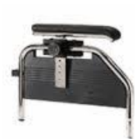
Extraïble y ajustable en altura

- Extraïbles/abatibles i regulables en altura.