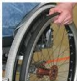
Aro especial Tetra